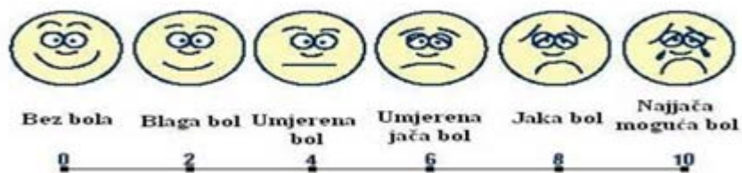
Slika 1.2. VAS skala za određivanje jačina bola